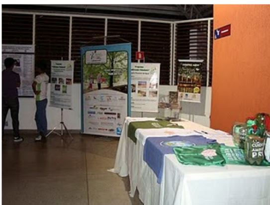
Materiais da Gincana Vivenciando os 3R's