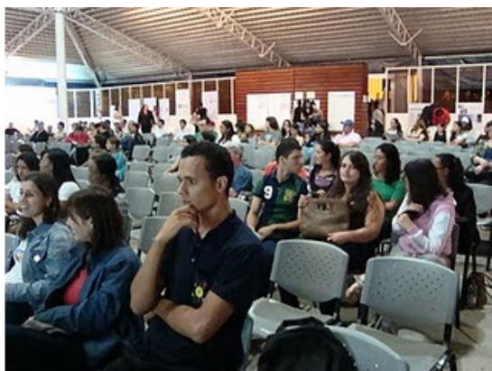
Participantes do I Encontro Interinstitucional