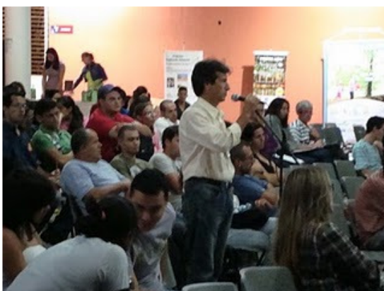
Participantes do evento