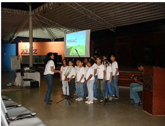
Abertura do Encontro com o Projeto Jovem Músico - Prefeitura Municipal de Uberaba (Secretaria de Municipal de Educação e Cultura).

Os certificados poderão ser retirados no final do mês de outubro juntos à coordenação de curso das faculdades e universidades parceiras (alunos que são vinculados a essas) e no Instituto Agronelli para os outros participantes. As palestras também serão disponibilizadas em breve para download no site do Instituto Agronelli.