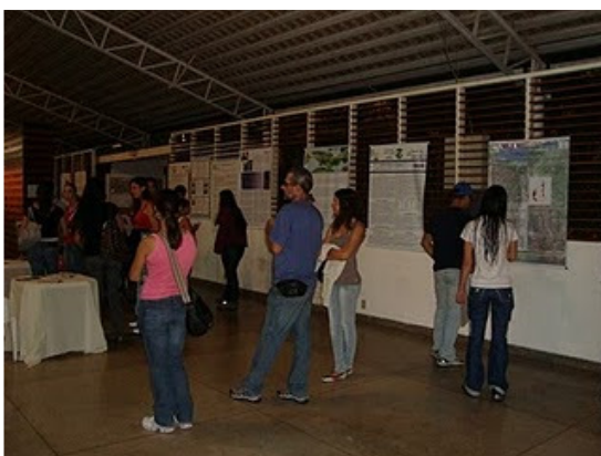
Hall de entrada - apresentação dos trabalhos acadêmicos